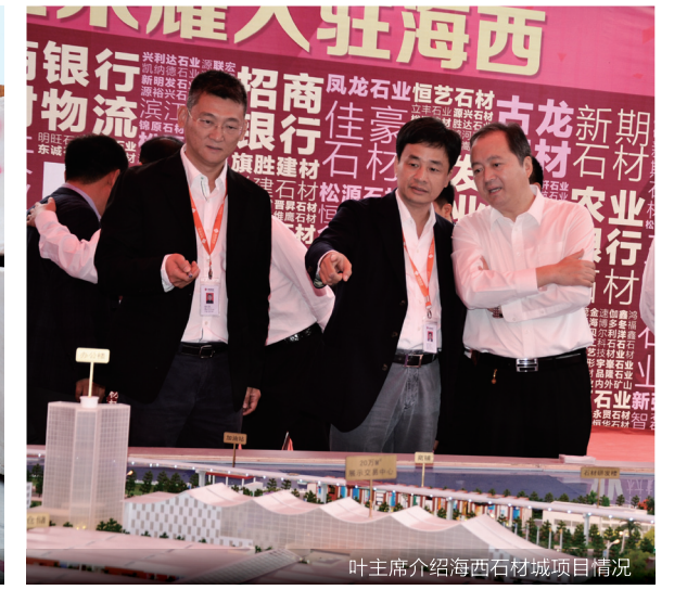
叶主席介绍海西石材城项目情况