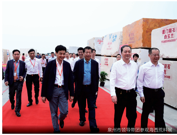
泉州市领导带团参观海西荒料展

11月8日上午，国内首届以荒料为主题的专业展会在海西石材城隆重举行。泉州市市长郑新聪、泉州市副市长陈荣洲、南安市市委书记黄南康、南安市市长王春金、南安市委常委副市长蔡龙群、中国石材协会会长邹传胜等有关领导莅临参观。 据了解，本次石材荒料展有367家石材企业参展，展出品种近千个。海西石材城相关负责人表示，海西石材荒料展举办第一天，已有不少客商对展出的荒料品种产生浓厚的兴趣，有意愿地进行咨询洽谈，并达成合作意向，效果显著。（《海西石材》杂志李燕坪 李世钦）