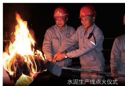
水泥生产线点火仪式

11月22日下午18:16，沸腾的窑火伴随着喜悦的爆竹声，海峡水泥日产4500吨熟料水泥生产线顺利点火啦。