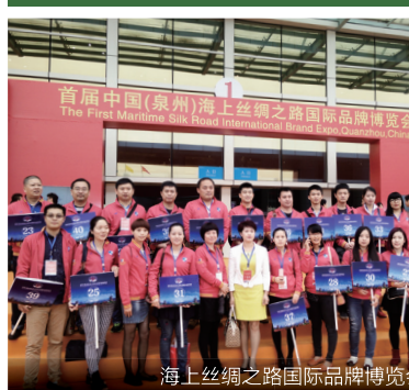
海上丝绸之路国际品牌博览会

11月28日—30日，首届中国（泉州）海上丝绸之路国际品牌博览会在南安市福建成功国际会展中心成功举办，南安市中国旅行社负责配合市政府接待来自境外参展商、